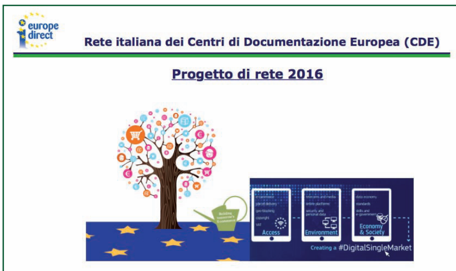
Figura 3. Homepage e logo del Progetto 2016 della Rete italiana dei Centri di Documentazione Europea