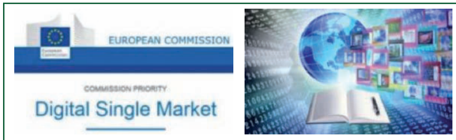
Figura 1. loghi del Digital Single Market

cerca di occupazione), e una società dinamica basata sulla conoscenza.